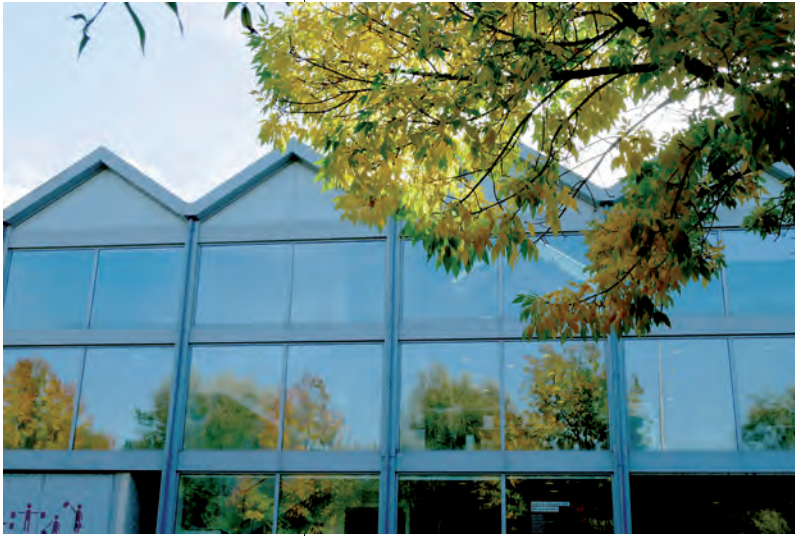
Vue de la Façade du Frac Site d'Angoulême