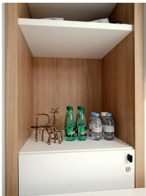
Émilie Perotto, TAKE CARE , fonderie de cupro-aluminium, 16 x 8 x 12 cm et 20 x 10 x 8 cm

TAKE CARE , «prendre soin», un ensemble de sculptures qui souligne la dimension sociale des modes de production collaboratifs. Il faut non seulement savoir déléguer, mais il est également nécessaire de mettre en place ce que l'artiste appelle un «réseau de soin».