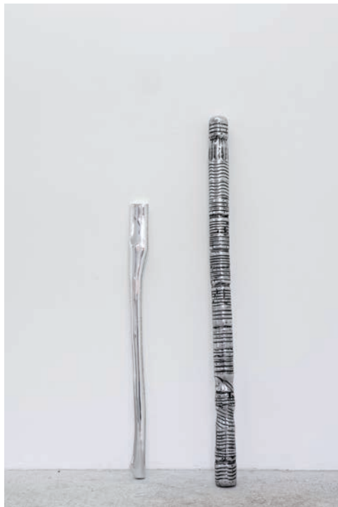
Émilie Perotto, Mhanchdos , aluminium taillé, 100 x 15 x 5 cm